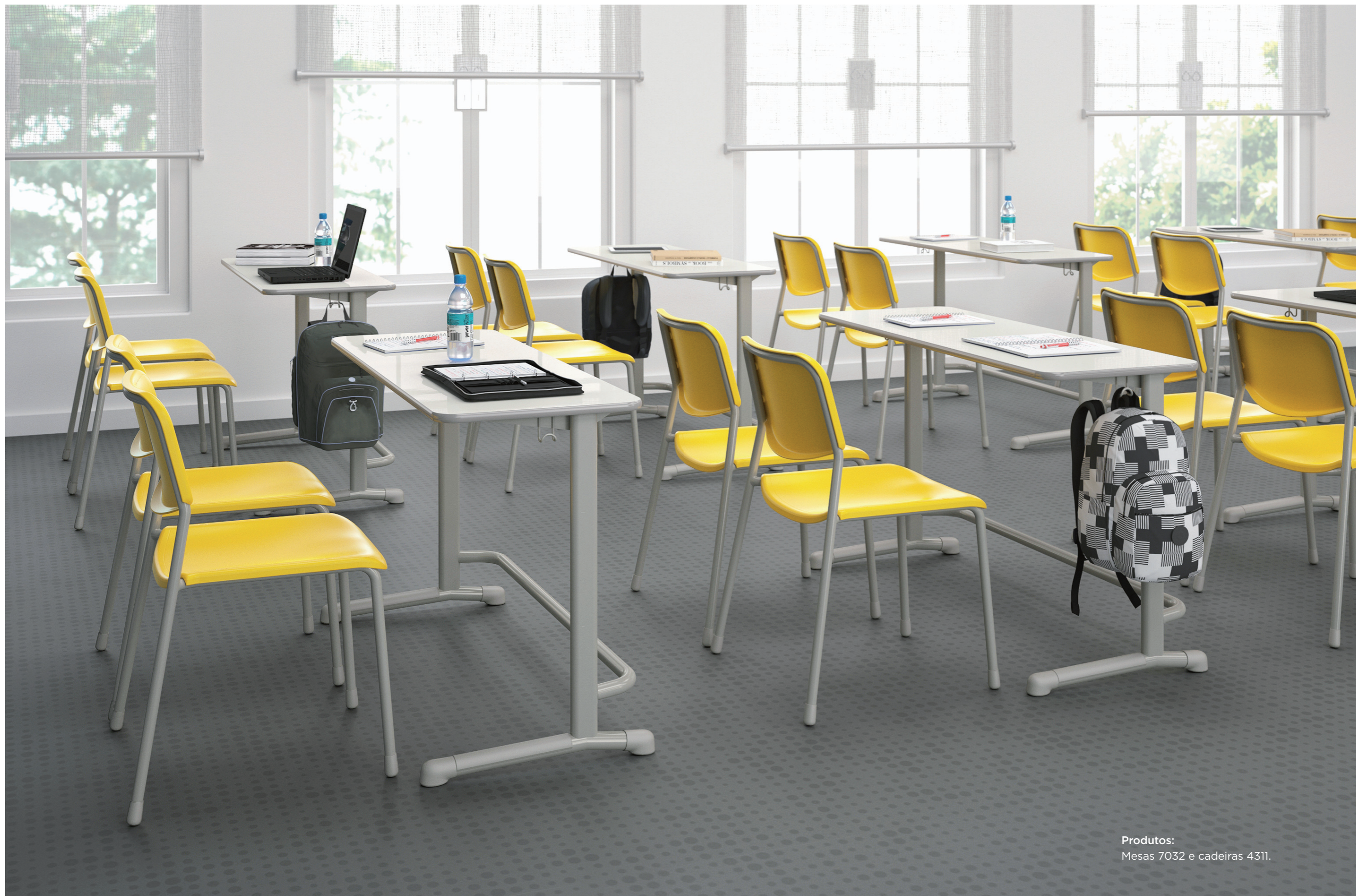
Produtos: Mesas 7032 e cadeiras 431.