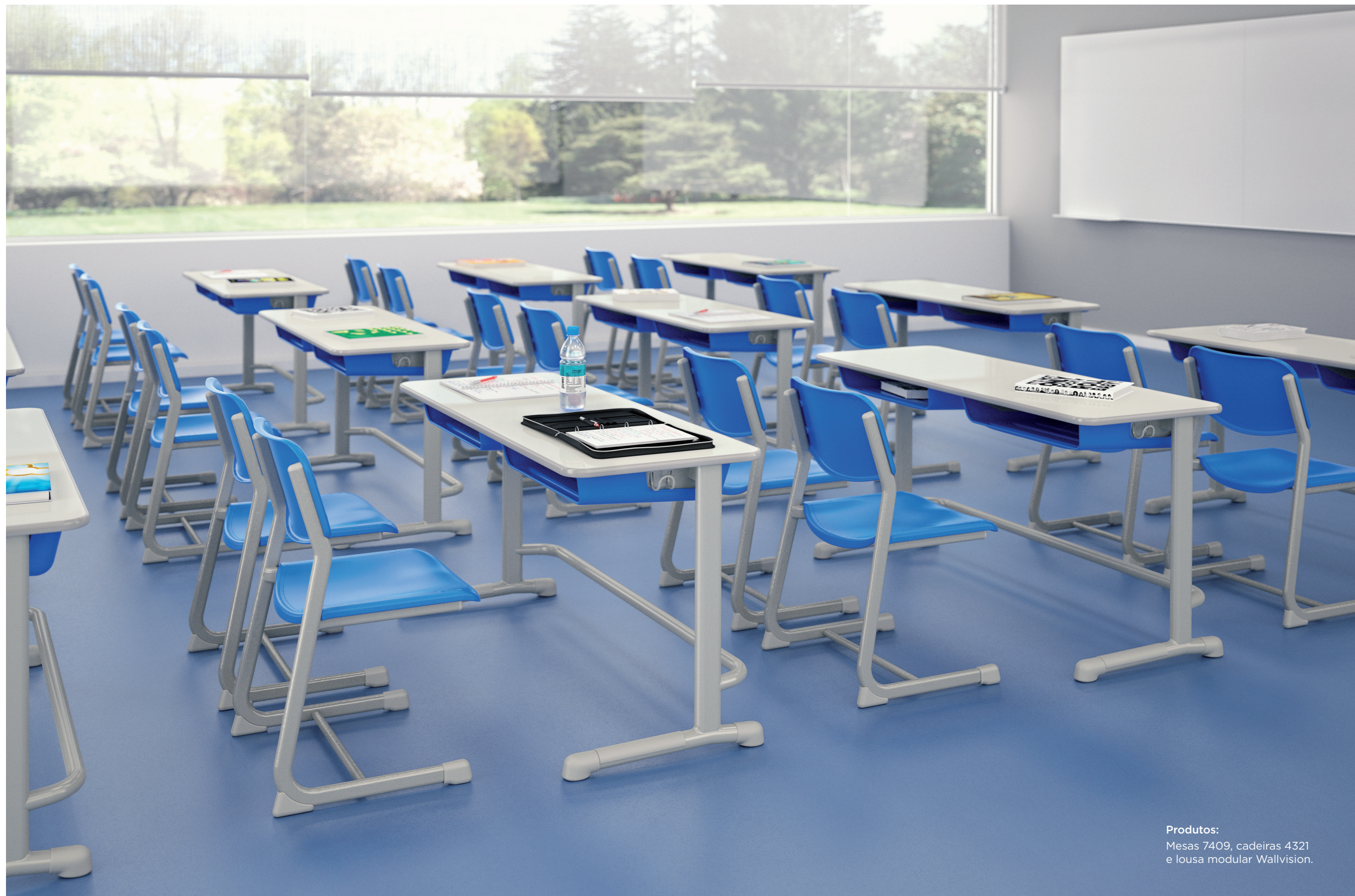
Produtos: Mesas 7409, cadeiras 4321 e lousa modular Wallvision.