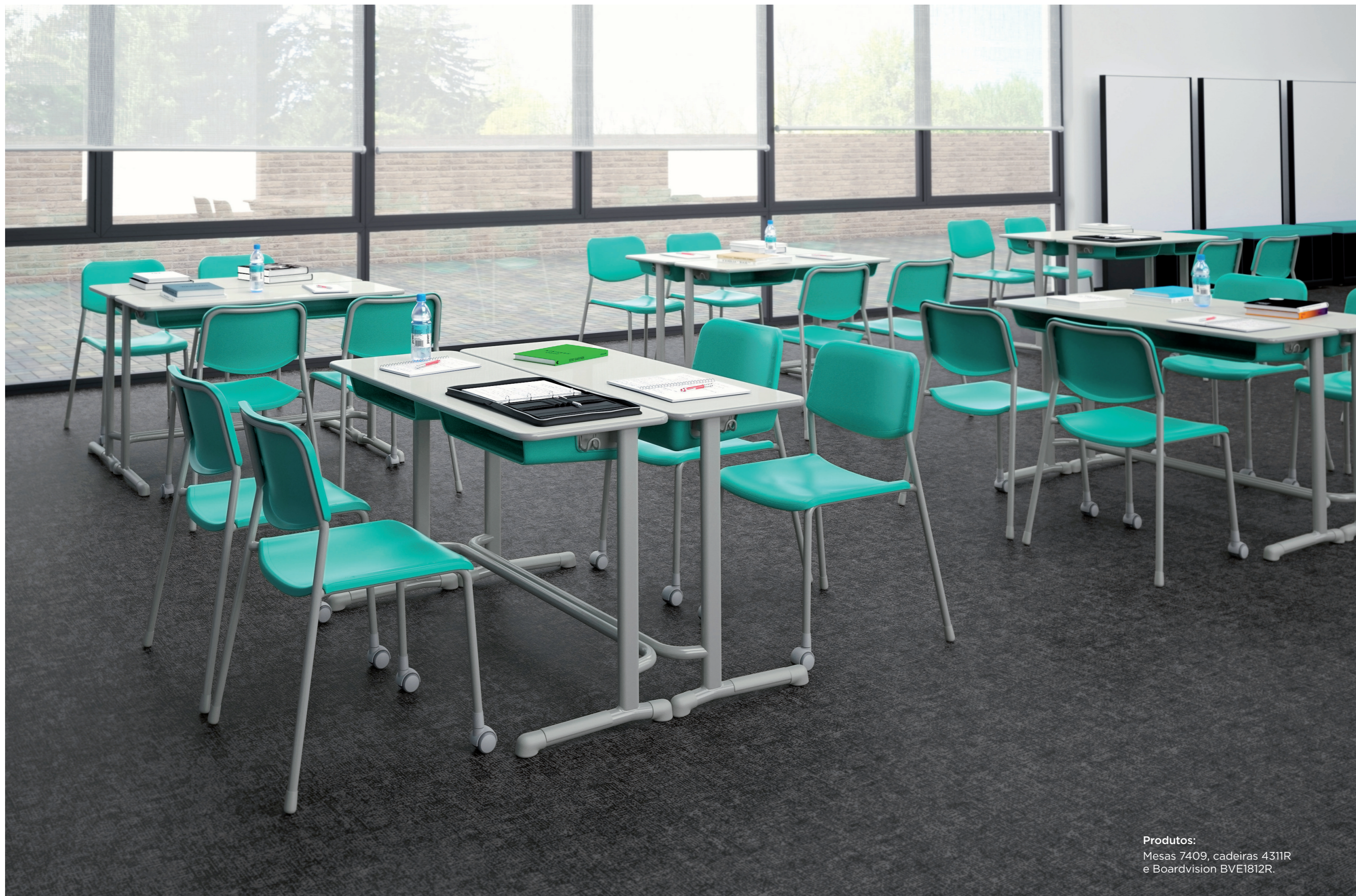
Produtos: Mesas 7409, cadeiras 4311R e Boardvision BVE1812R.